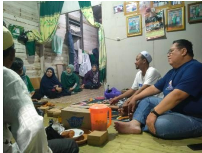
Gambar 2. Pelaksanaan kegiatan penyuluhan

mengikuti kegiatan dan tidak hanya sebatas komunikasi. Peserta juga menyimak dengan baik penyampaian materi yang dibawakan pemateri. Berikut gambar pembukaan kegiatan PKM dan penyampaian materi dari pemateri kegiatan Pembuatan Nugget Pisang.