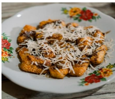
Gambar 3. Nugget Pisang yang sudah siap disajikan

Pada bagian ini masyarakat sangat antusias sekali mengikuti kegiatan penyuluhan tentang Pembuatan Nugget Pisang, banyak pertanyaan yang diajukan kepada kami mulai dari tanaman pisang varitas apa yang baik untuk dijadikan