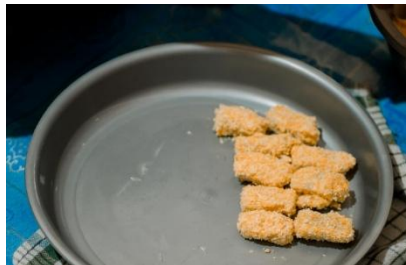
Gambar 3. Adonan pada kegiatan Pembuatan Nugget Pisang.