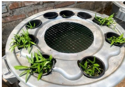
Gambar 3. Budidaya Lele dan Kangkung Metode Budikdamber

Hasil pelaksanaan budikdamber ini dapat dimanfaatkan sebagai sumber pangan bagi masyarakat, sehingga dapat memenuhi kebutuhan protein hewani dari hasil budidaya mandiri. Selain itu, teknik akuaponik untuk budidaya kangkung yang diterapkan secara bersamaan dengan budikdamber juga akan menghasilkan bahan pangan berupa sayuran yang dapat menjadi suplai nabati bagi masyarakat. Untuk hasil pembudidayaan lele dan kangkung pada Budikdamber dapat dilihat pada Gambar 3.