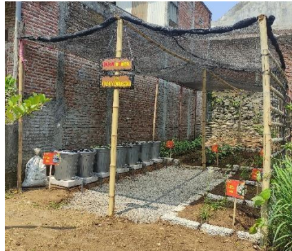
Gambar 2. Realisasi Program Urban Farming

pelaksanaan urban farming dapat menjadi solusi untuk menciptakan kemandirian serta ketahanan pangan pada masyarakat. Untuk hasil tanaman pada urban farming dapat dilihat pada Gambar 2