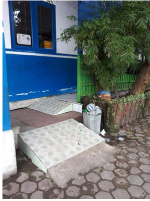
Gambar 5. Ramp di salah satu sekolah inklusif

Ramp adalah jalur sirkulasi yang memiliki bidang dengan kemiringan tertentu, sebagai alternatif bagi orang yang tidak dapat menggunakan tangga. Persyaratan pembuatan ramp adalah (1) kemiringan di dalam bangunan tidak boleh melebihi 7^\circ , sedangkan kemiringan di luar bangunan maksimum 6^\circ ; (2) panjang mendatar (dengan kemiringan 7^\circ ) tidak boleh lebih dari 900 cm, jika dengan kemiringan yang lebih rendah dapat lebih panjang; (3) lebar minimum 95 cm tanpa tepi pengaman, dan 120 cm dengan tepi pengaman; (4) muka datar ( bordes ) pada awalan atau akhiran dari suatu ramp harus bebas dan datar sehingga memungkinkan untuk memutar kursi roda dengan ukuran minimum 160 cm; (5) permukaan datar awalan atau akhiran harus memiliki tekstur sehingga tidak licin baik diwaktu hujan; (6) lebar tepi pengaman 10 cm; (7) ramp harus diterangi dengan pencahayaan yang cukup; (8) ramp harus dilengkapi dengan pegangan rambatan ( handrail ) yang dijamin kekuatannya dengan ketinggian yang sesuai (Keputusan Menteri Pekerjaan Umum No. 648 Tahun 1998).