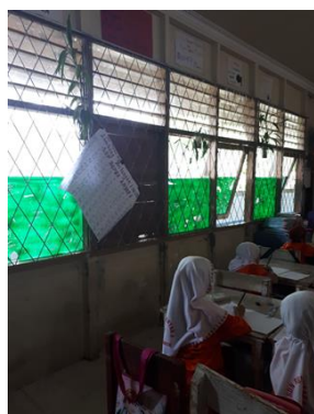
Gambar 3. Hiasan dinding terlepas