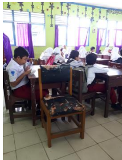
Gambar 4. Kursi GPK

Tanggung jawab pengelolaan fasilitas, terutama pemeliharaan dan perawatan prasarana pendidikan merupakan tanggung jawab bersama baik kepala sekolah, guru, siswa, dan pegawai/karyawan. Mereka bekerja sama menjaga dan merawat segala bentuk prasarana yang ada di sekolah agar senantiasa terjaga kualitasnya, awet dan tidak lekas rusak. Kelengkapan dan pengelolaan prasarana pembelajaran yang memadai akan menunjang proses pembelajaran yang teratur dan berkelanjutan. Itu akan membuat para siswa merasa nyaman dan betah untuk belajar di sekolah.