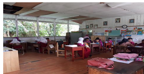
Gambar 1. Plafon kelas terkoyak/bolong

Di beberapa sekolah kelengkapan prasarana pendidikan ini disertai dengan perawatan dan pengelolaan yang baik sehingga tampak rapih dan asri, namun sebagian lagi tidak diiringi dengan perawatan dan penataan yang baik, seperti plafon yang dibiarkan terkoyak dan bolong, hiasan dinding yang miring dan menempel tidak sempurna, bangku dan meja yang penuh dengan coret-coretan, serta cat dinding yang banyak mengelupas. Disamping itu lingkungan sekolah juga kurang bersih, banyak sampah di rawa-rawa bagian bawah bangunan, sampah di sekitar toilet, dan tumpukan barang tidak terpakai di dapur atau gudang dekat toilet.